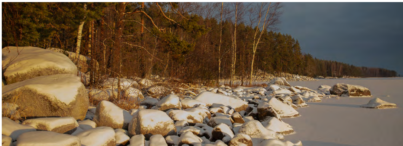
Näkymä kaava-alueen rannasta.

Mikäli hyväksymispäätöksestä ei valiteta, kaava tulee voimaan kuuluksella.